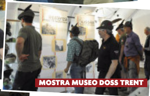
MOSTRA MUSEO DOSS TRENT