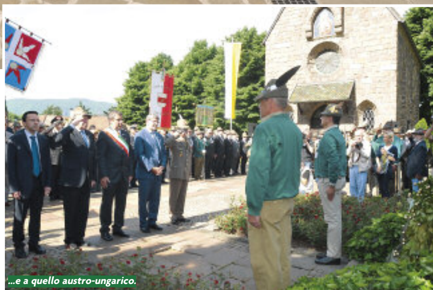
...e a quello austro-ungarico.

Venerdì mattina, conclusa la cerimonia dell'alzabandiera, da piazza Mazzini, il presidente Perona con il Consiglio Direttivo Nazionale, il comandante delle Truppe alpine e il picchetto d'onore si sono trasferiti al rione di san Giacomo, per rendere omaggio ai Caduti sepolti nel cimitero militare formato da due settori attigui, con soldati dell'esercito austro-ungarico della prima guerra mondiale e altoatesini Caduti nella seconda guerra mondiale nei diversi fronti con l'esercito tedesco. La cerimonia è stata breve ma solenne: squilli di tromba, l'onore ai Caduti e deposizione di una corona all'altare italiano al suono del Silenzio . Poco dopo, picchetto e autorità si sono spostati nel campo accanto per deporre una corona all'altare della chiesetta, mentre il trombettiere suonava il Silenzio austriaco.