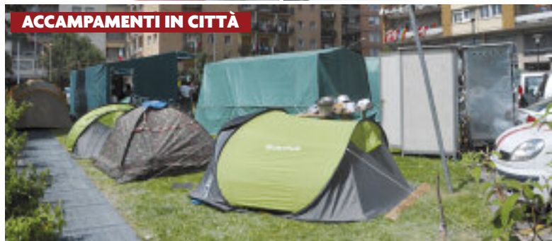
ACCAMPAMENTI IN CITTÀ