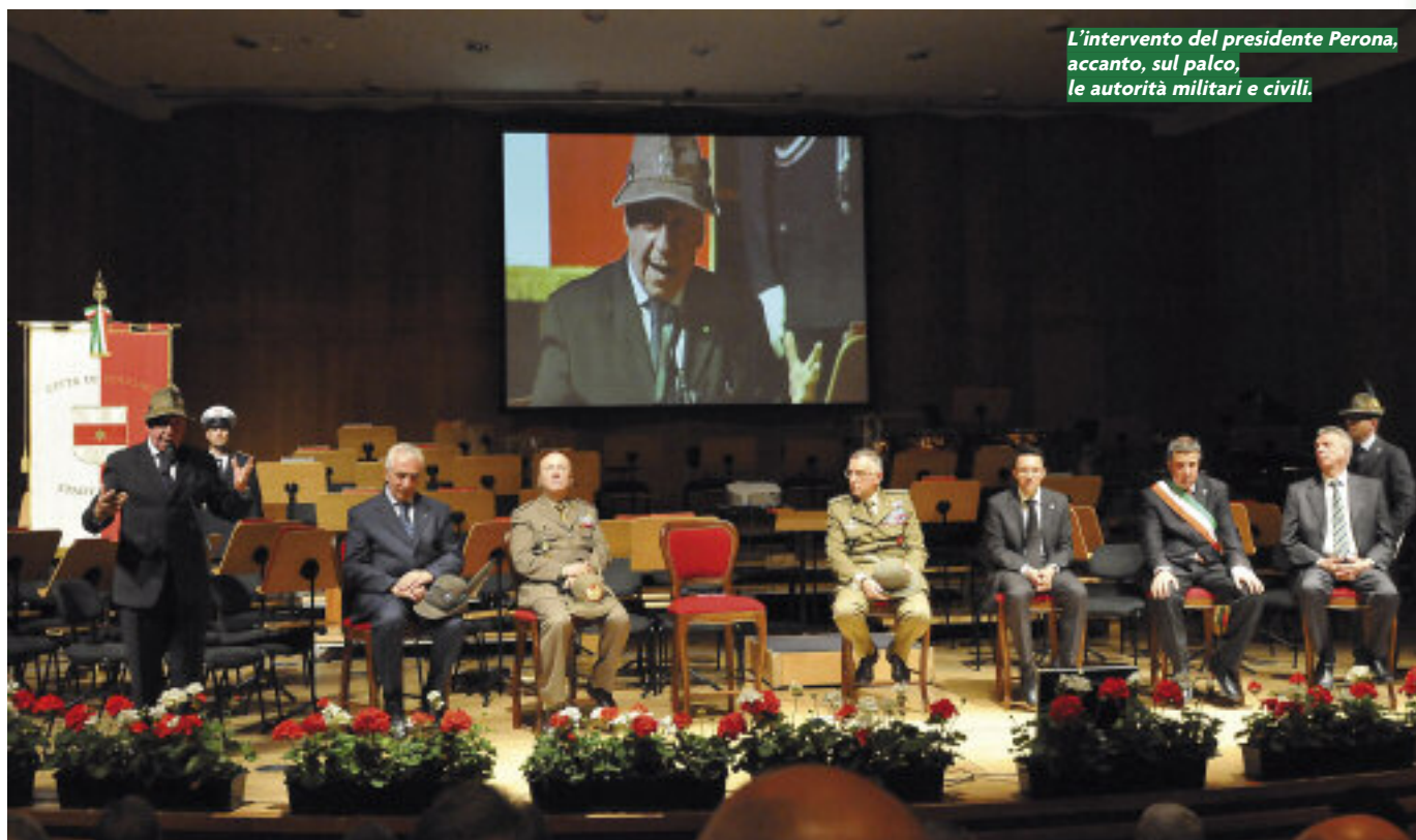
L'intervento del presidente Perona, accanto, sul palco, le autorità militari e civili.