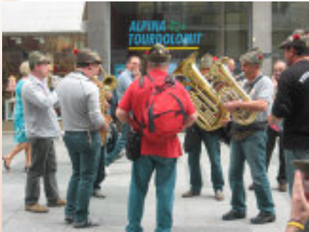
Nelle foto: Un momento della festa a Merano e la caserma Rossi.