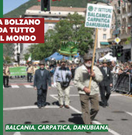
BALCANIA, CARPATICA, DANUBIANA