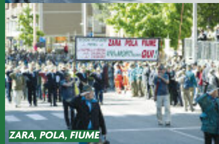
ZARA, POLA, FIUME