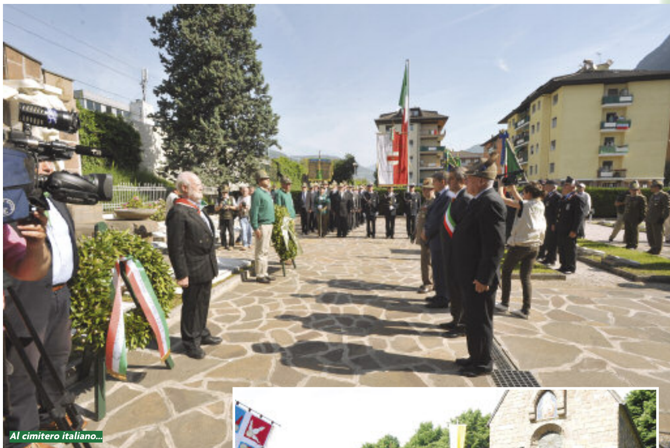
Al cimitero italiano...

Venerdì mattina, conclusa la cerimonia dell'alzabandiera, da piazza Mazzini, il presidente Perona con il Consiglio Direttivo Nazionale, il comandante delle Truppe alpine e il picchetto d'onore si sono trasferiti al rione di san Giacomo, per rendere omaggio ai Caduti sepolti nel cimitero militare formato da due settori attigui, con soldati dell'esercito austro-ungarico della prima guerra mondiale e altoatesini Caduti nella seconda guerra mondiale nei diversi fronti con l'esercito tedesco. La cerimonia è stata breve ma solenne: squilli di tromba, l'onore ai Caduti e deposizione di una corona all'altare italiano al suono del Silenzio . Poco dopo, picchetto e autorità si sono spostati nel campo accanto per deporre una corona all'altare della chiesetta, mentre il trombettiere suonava il Silenzio austriaco.