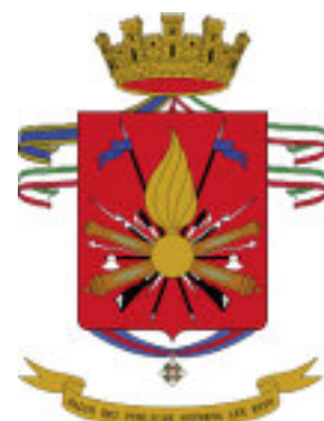
Stemma araldico dell'Esercito italiano.

Prende la parola il Capo di Stato Maggiore dell'Esercito, gen. C.A. Graziano. Dopo l'omaggio ai Caduti e ai feriti nelle missioni all'estero con voce ferma, ma senza enfasi, dice che l'Esercito rappresenta una delle più belle espressioni della società, simbolo dell'unità nazionale. "Questo efficace strumento è organizzato per una pronta integrazione in ambito NATO" e costituisce un riferimento affidabile nelle sfide che ci attendono. La sua forza poggia sulla disciplina, l'addestramento e la motivazione. Il Capo di Stato Maggiore della Difesa, gen. Abrate apre il suo intervento con espressioni di vicinanza ai 6.500 militari impegnati nelle 25 missioni loro affidate dal Parlamento; si complimenta per i risultati ottenuti e per i lusinghieri riconoscimenti rice-