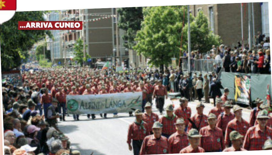
A BOLZANO DA TUTTO IL MONDO