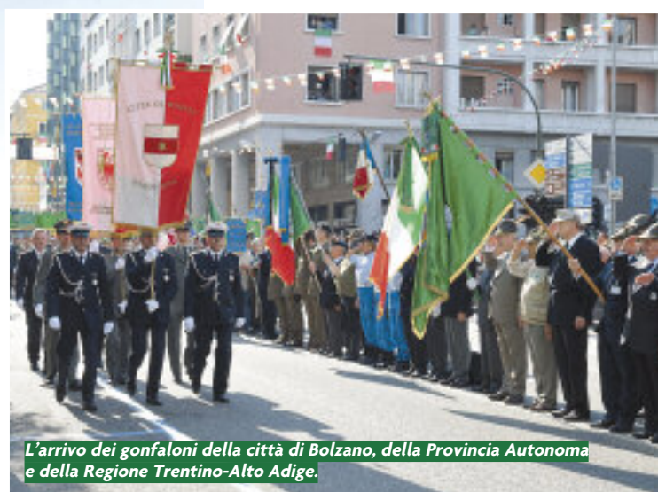
L'arrivo dei gonfaloni della città di Bolzano, della Provincia Autonoma e della Regione Trentino-Alto Adige.

L'Adunata è stata aperta ufficialmente venerdì mattina, con l'alzabandiera in piazza Mazzini. Alle 9 c'era un quadrato di vessilli, gagliardetti e una compagnia del 2° reggimento alpino Trasmissioni davanti al palco con tre pennoni: per la bandiera italiana, quella dell'Europa e di Bolzano. In prima fila le massime autorità, con il sindaco, il prefetto, il questore, il vice presidente della Provincia Tommasini. Il segretario generale dell'Associazione, gen. Silverio Vecchio - accolto da un caloroso applauso che ha fatto comprendere con quanta partecipazione fosse atteso quel primo momento dell'Adunata - ha dato il benvenuto alle centinaia di alpini e bolzanini che gremivano la piazza. Poi sono stati resi gli onori ai gonfaloni della città di Bolzano, della Provincia autonoma e della Regione Trentino-Alto Adige. Infine l'ingresso del Labaro, scortato dal presidente Perona e dal Consiglio direttivo. Il generale Primicerj, comandante delle Truppe alpine ha passato in rassegna lo schieramento e infine l'ordine: "Alzabandiera!". L'Inno di Mameli ha seguito il Tricolore e le altre due bandiere che salivano sui pennoni mentre tutta la piazza cantava il "Fratelli d'Italia". Cominciava la tre giorni che sarebbe stata indimenticabile. ●