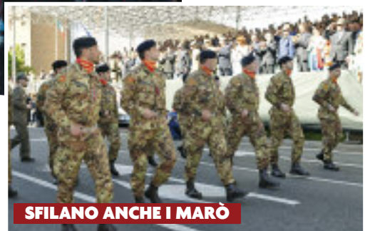
SFILANO ANCHE I MARÒ