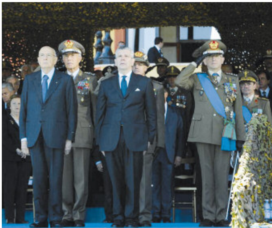
In primo piano, da sinistra: il Presidente della Repubblica Napolitano, il Ministro della Difesa ammiraglio Di Paola e il Capo di Stato Maggiore dell'Esercito gen. C.A. Graziano.

La mattina del 4 maggio, sui grandi spazi dell'Ippodromo Militare "Giannattasio" di Roma sono schierati alcuni mezzi militari di ultima generazione e due compagnie di cavalleggeri tengono in attività i loro destrieri con piccolo trotto, cariche a spada sguainata, passo lento. C'è aria di festa nel ritrovare amici, salutare ufficiali e militari in alta uniforme in attesa dell'inizio della cerimonia per il 151° della costituzione del nostro Esercito, erede della sabauda Armata Sarda. Sulle note dell'Inno nazionale eseguito dalla banda militare, composta da oltre cento elementi, tutti con diploma di conservatorio, alzabandiera e subito dopo schieramento di una brigata di formazione in rappresentanza di tutte le specialità. Con l'ingresso dei Medaglieri e Labari delle associazioni combattentistiche e d'arma, dei gonfaloni della Capitale, della Provincia, della Regione e della Bandiera di guerra dell'Esercito si concludono i preliminari della cerimonia. Nel frattempo le massime autorità militari e di governo hanno preso posto in tribuna e fra queste c'è il nostro presidente nazionale Corrado Perona e il de-