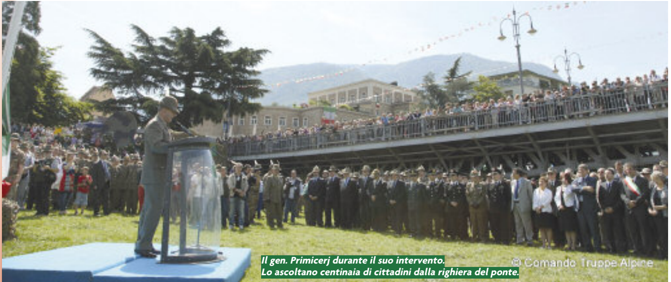
Il gen. Primicerj durante il suo intervento. Lo ascoltano centinaia di cittadini dalla righiera del ponte.