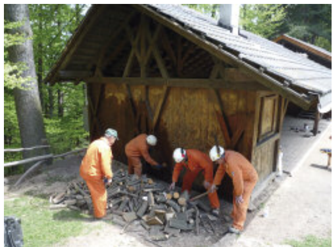
Un momento della sistemazione e della tinteggiatura della baita.

Gestione dei servizi - Per l'85ª Adunata nazionale, i volontari della P.C. dell'Associazione Nazionale Alpini hanno svolto, oltre alle varie attività rivolte al recupero di strutture della città di Bolzano in precedenza descritte, una gestione di servizi connessi con l'organizzazione generale dell'Adunata. Evidenzio che presso la caserma Cador-