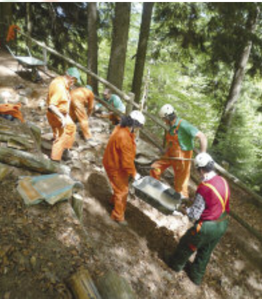
Alpini al lavoro sul sentiero che porta alla baita comunale al Colle.

La sensibilità per il patrimonio culturale, la natura e l'ambiente è uno dei tanti valori che contraddistinguono gli alpini. Come segno tangibile di riconoscimento alla comunità che ospita l'evento, gli alpini della Protezione Civile dell'ANA nei giorni che hanno preceduto l'Adunata, hanno realizzato alcuni interventi di ripristino e sistemazione di opere ed infrastrutture pubbliche a beneficio della Città di Bolzano e della comunità cittadina. Con il coordinamento del Servizio Tecnico Ambientale e di Progettazione del Verde del Comune di Bolzano, sono stati individuati quattro importanti interventi ambientali dedicati al capoluogo e realizzati in maniera curata e professionale. Lunedì 7 maggio gli alpini della Protezione Civile, si sono messi all'opera per dare il meglio di sé per l'esecuzione delle opere individuate congiuntamente con l'amministrazione comunale.