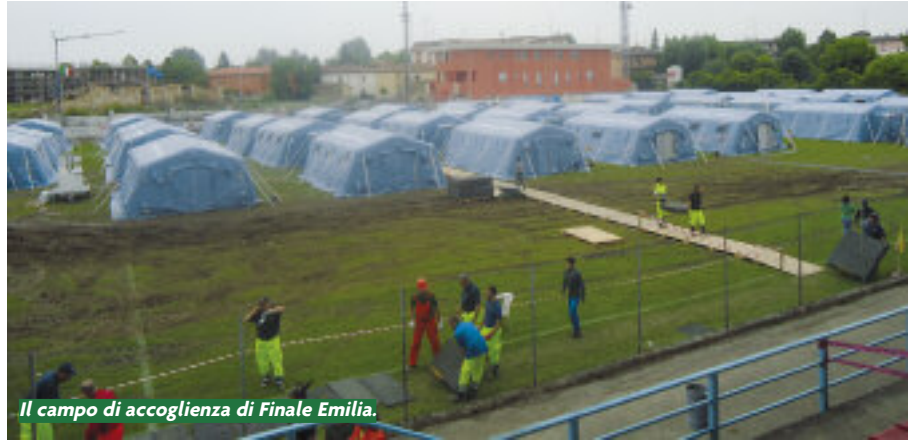
Il campo di accoglienza di Finale Emilia.

I volontari della Protezione Civile ANA sono impegnati in Emilia Romagna in soccorso alla popolazione colpita dal terremoto. Nella notte di sabato 19 maggio, immediatamente dopo la scossa, sono intervenuti i volontari alpini dell'Emilia Romagna, attivati dai rispettivi Comuni. Qualche ora dopo la Regione ha allertato la Colonna mobile di Protezione Civile. Da circa venti volontari con la penna presenti nelle prime ore del 20 maggio si è arrivati a 60-70 che operano nelle province di Ferrara e Modena per rilevare i danni sul territorio. Hanno inoltre allestito un campo di accoglienza per 250 persone presso le strutture sportive di Finale Emilia. È stata attivata, su richiesta del Dipartimento nazionale, anche la Colonna mobile ANA formata principalmente da volontari del 3° Raggruppamento. Altri 60 volontari alpini sono partiti dal Veneto nel tardo pomeriggio di domenica 20 maggio e sono arrivati a Finale Emilia in serata per il montaggio delle tende di un secondo campo per 250 sfollati, con servizi, cucina e refettorio. Stanno operando le squadre ANA delle specialità di comunicazioni radio, sanità e il nucleo informatico. Dal pomeriggio del 21 maggio sono stati inoltre impiegati i volontari alpini al seguito delle colonne mobili del Friuli, della provincia di Trento e della Regione Piemonte che operano a San Felice sul Panaro.