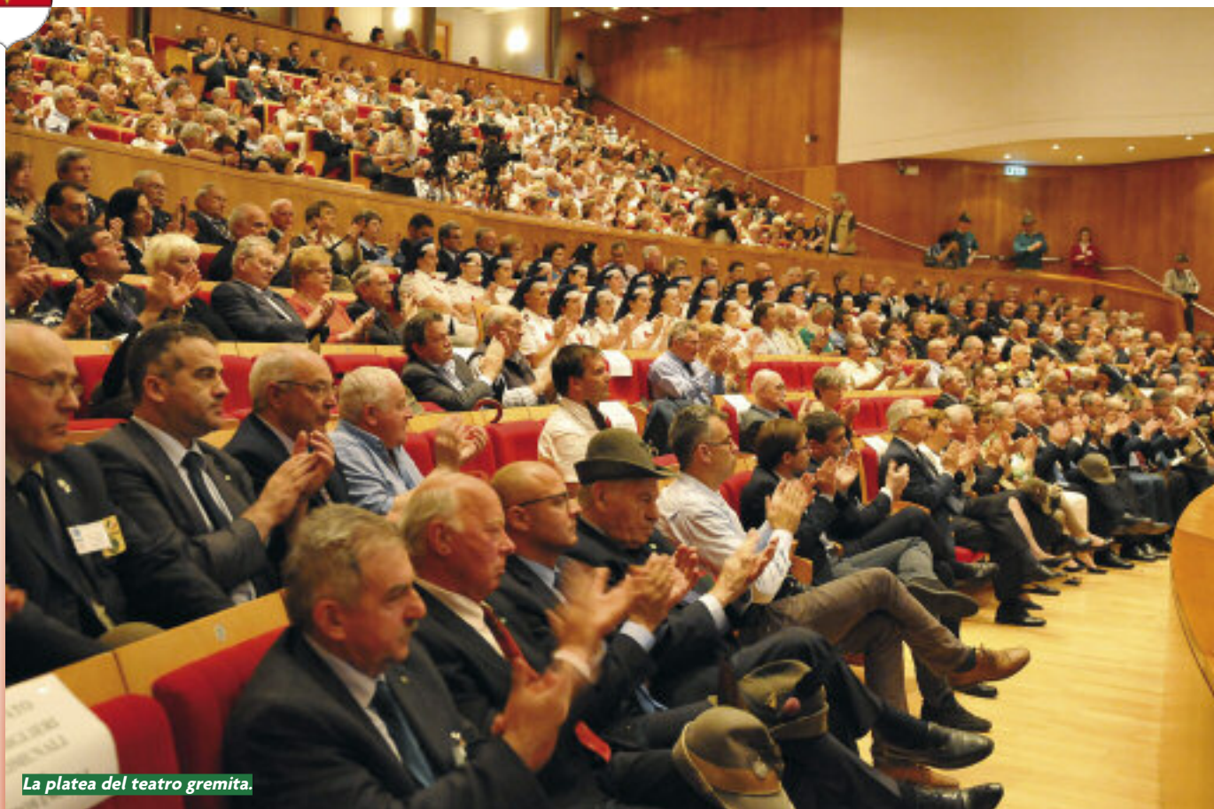
La platea del teatro gremita.