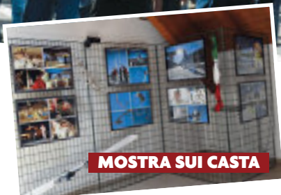
MOSTRA SUI CASTA