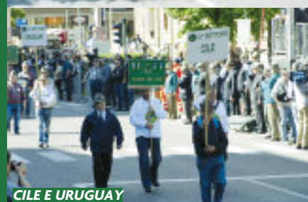
CILE E URUGUAY