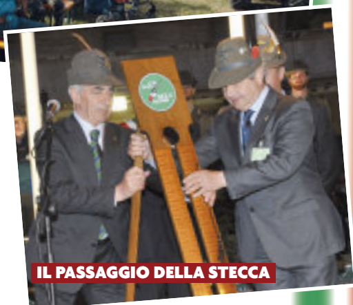
IL PASSAGGIO DELLA STECCA