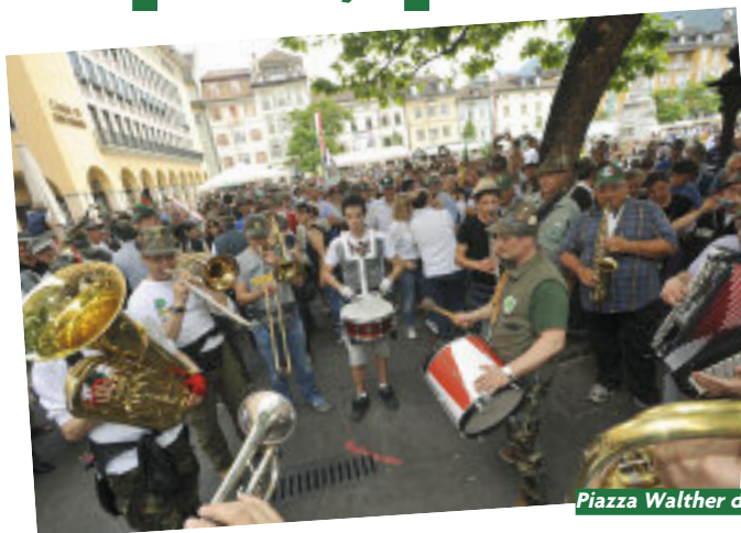
Piazza Walther durante la festa... e dopo.