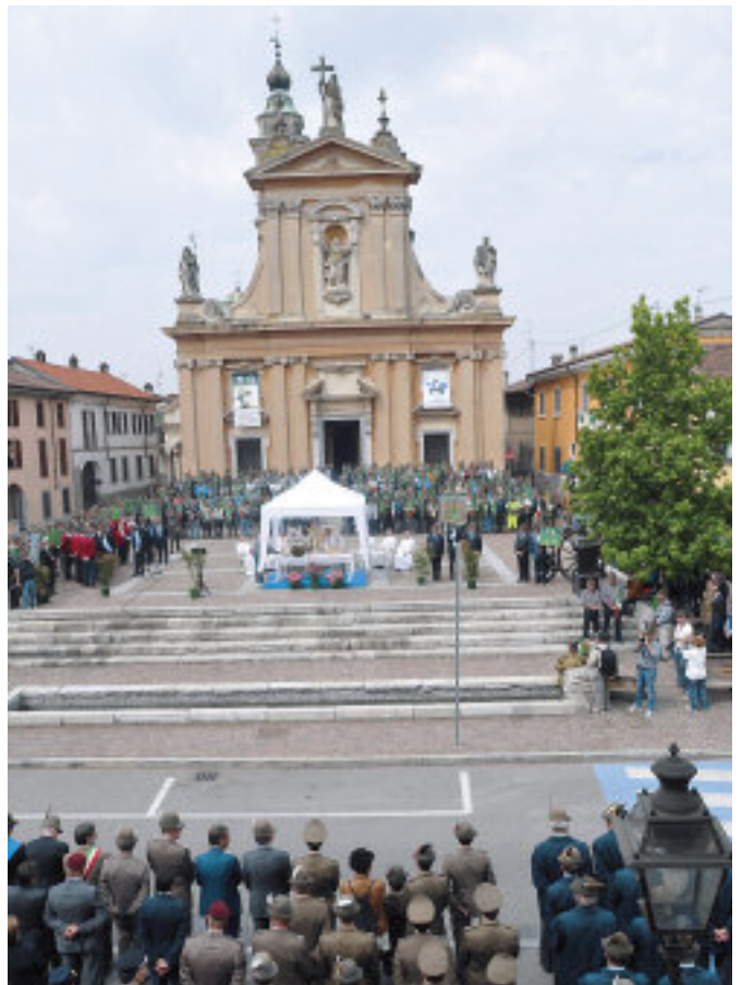
Piazza Delucca durante la Messa officiata da mons. Pelvi.